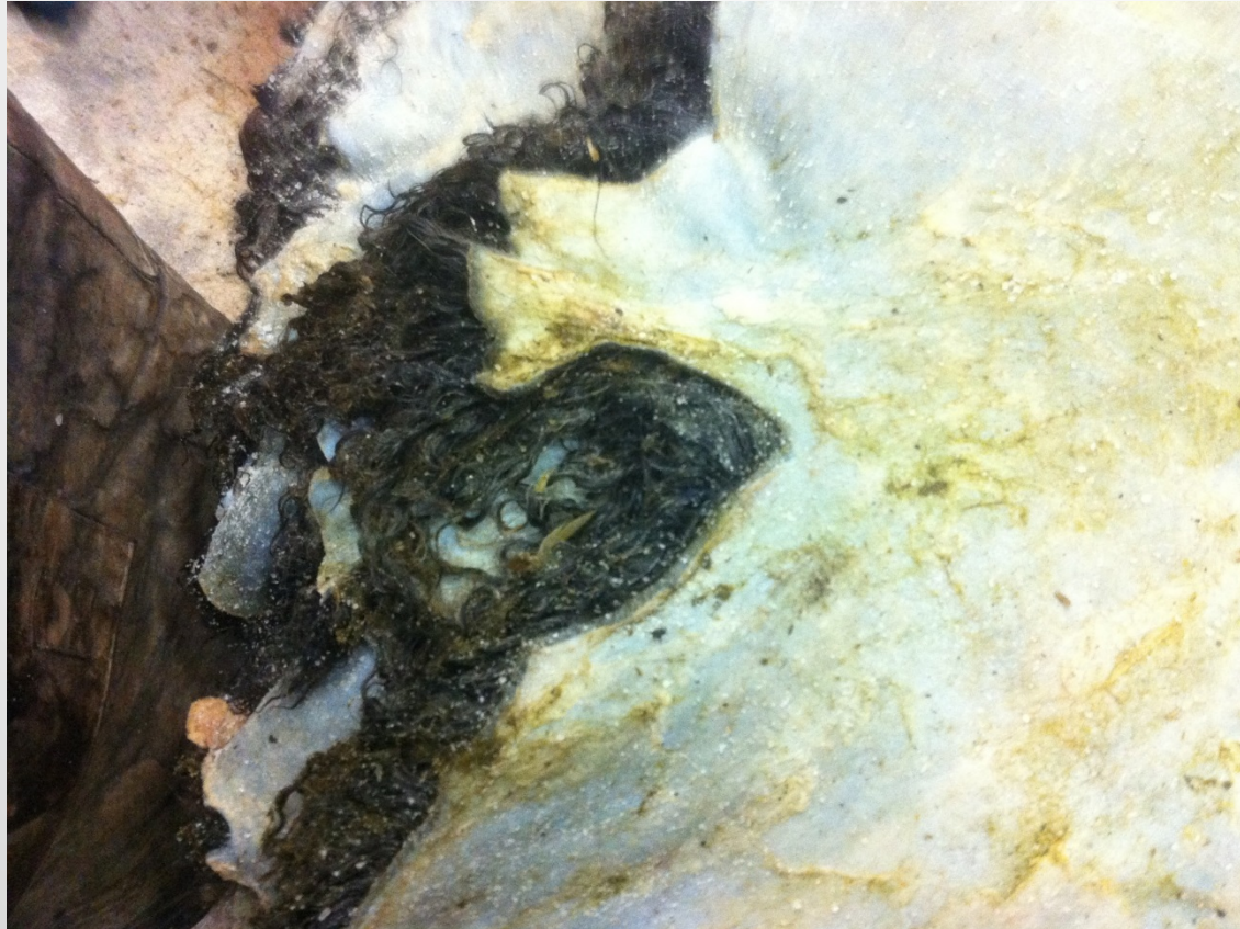
Reva vid framben