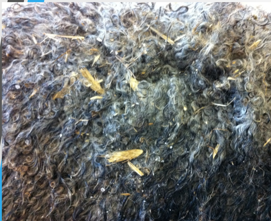
Skinn med mycket spindelull