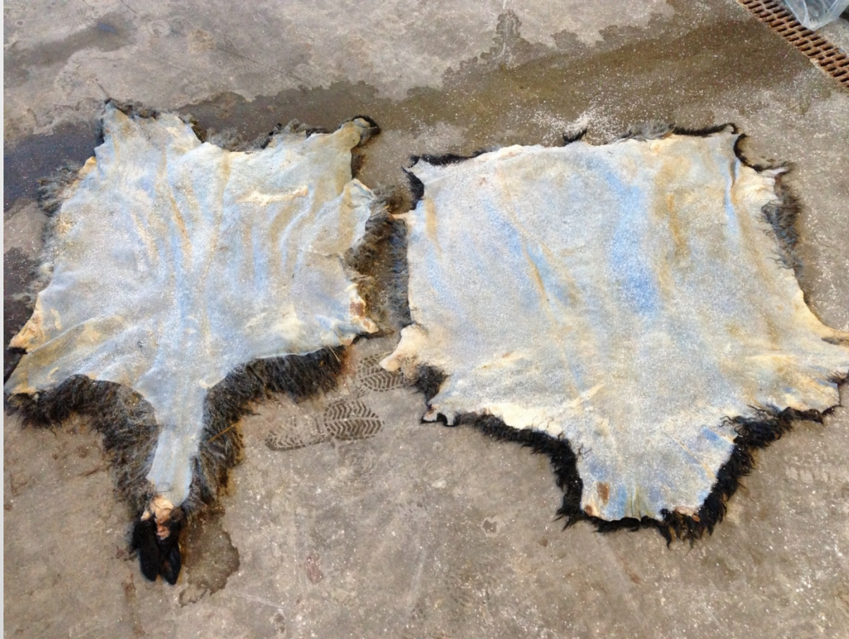
Långsmal nacke / "normalt" skinn