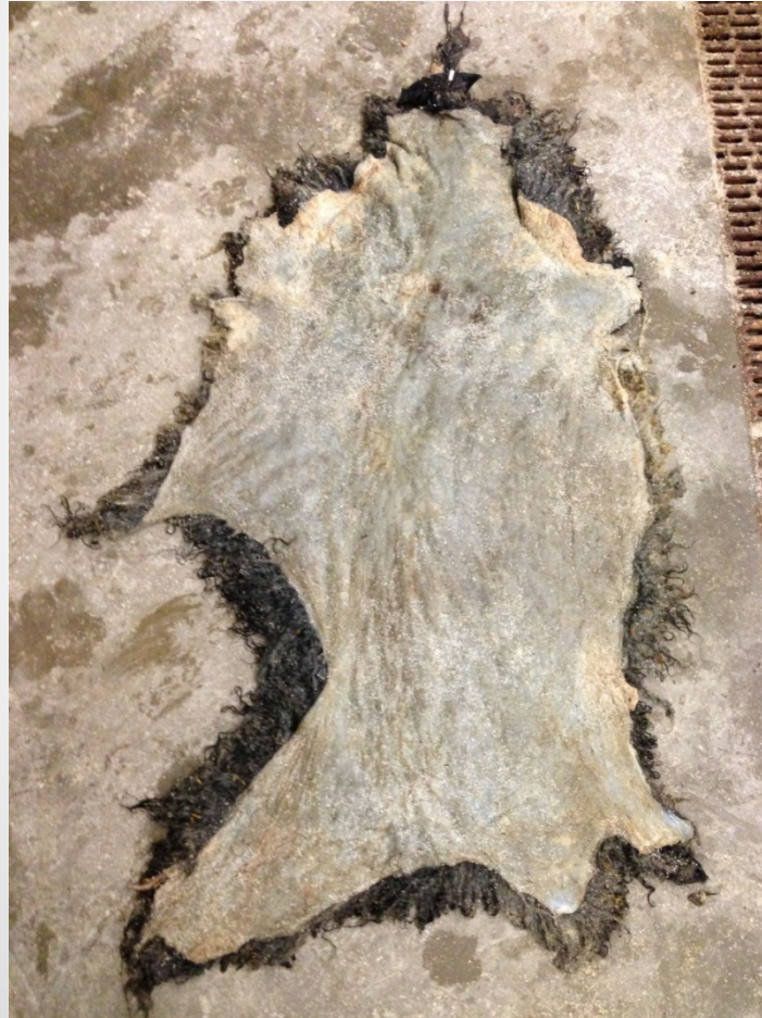
Stor reva i sidan – del fattas