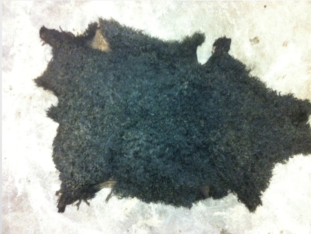
Hårt skuren ljumske – sett från ullsidan