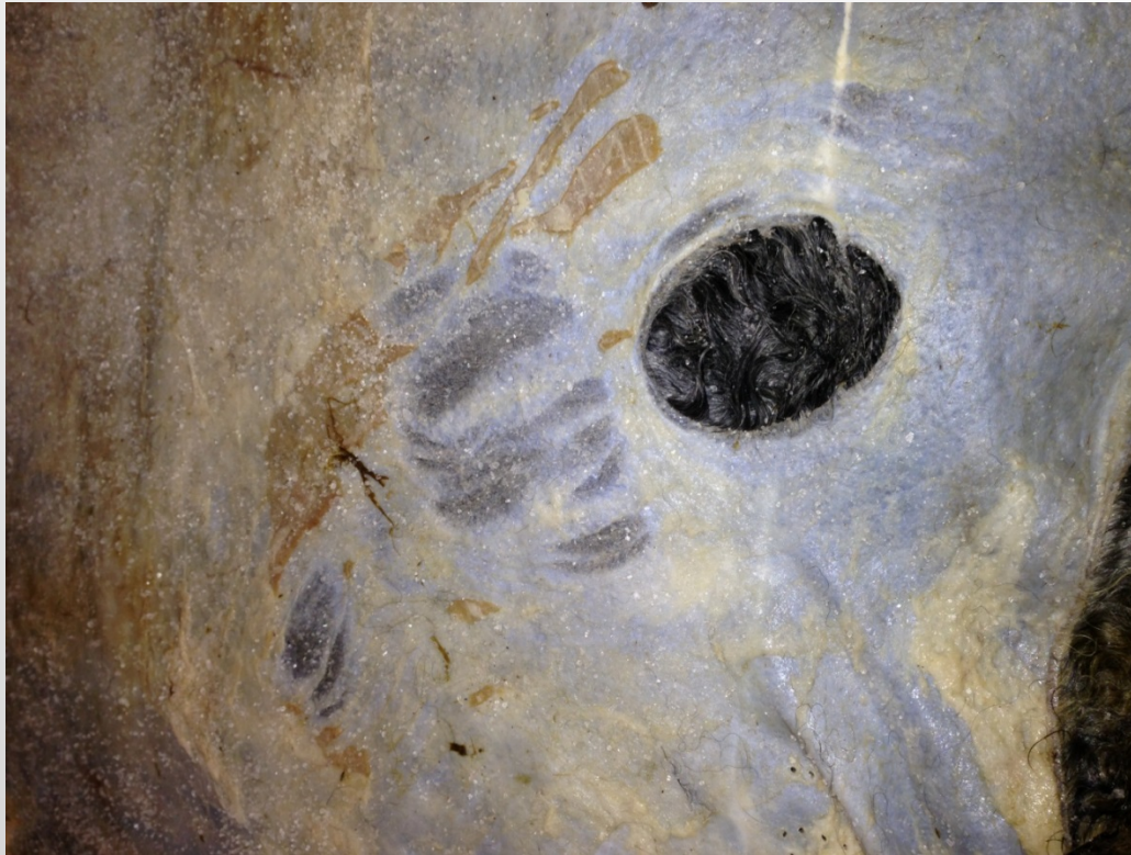
Mycket flåhål & knivmärken

Mindre flåhål lagas i samband med beredningen men som i fallet här bredvid går det inte att laga det eftersom hålet är för stort och runt.