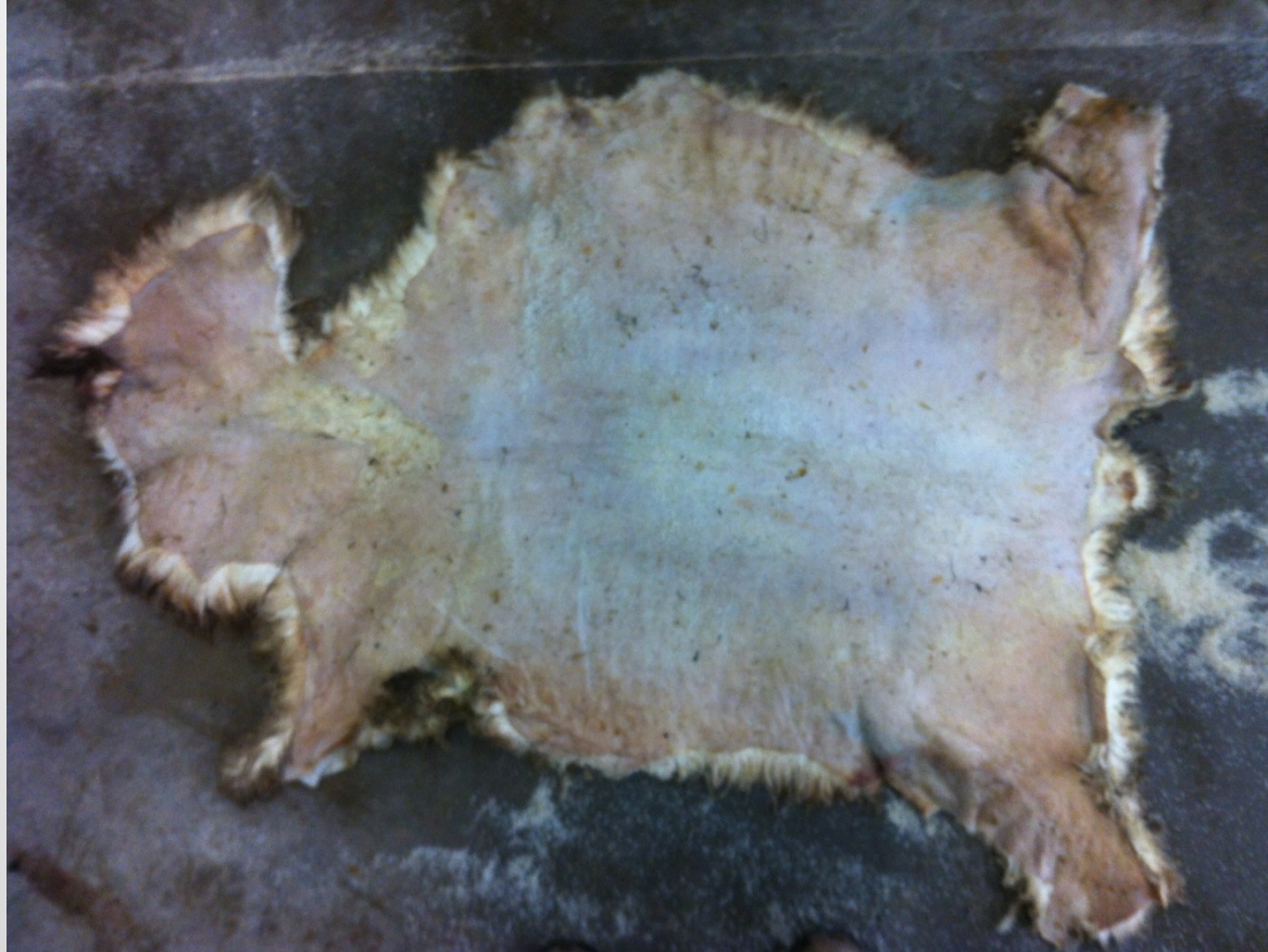
Stor reva vid nacken