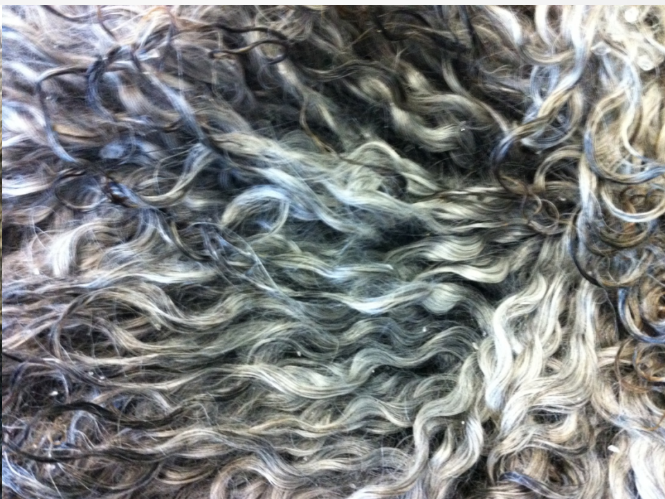
Skinn med mindre spindelull